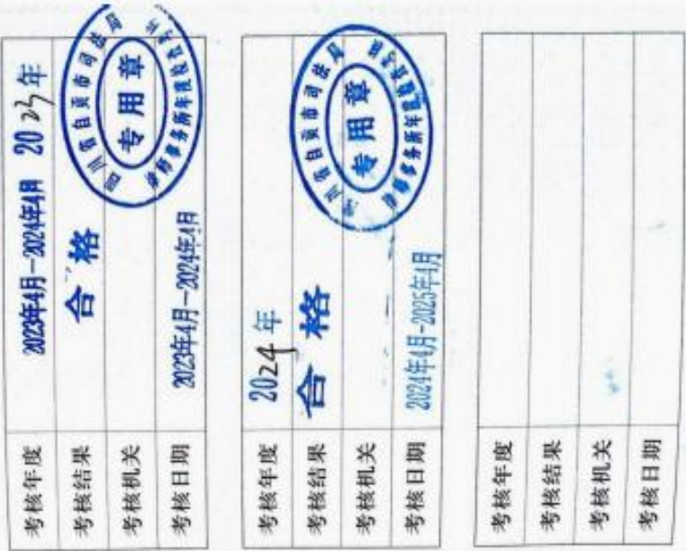
律师事务所年度考核记录